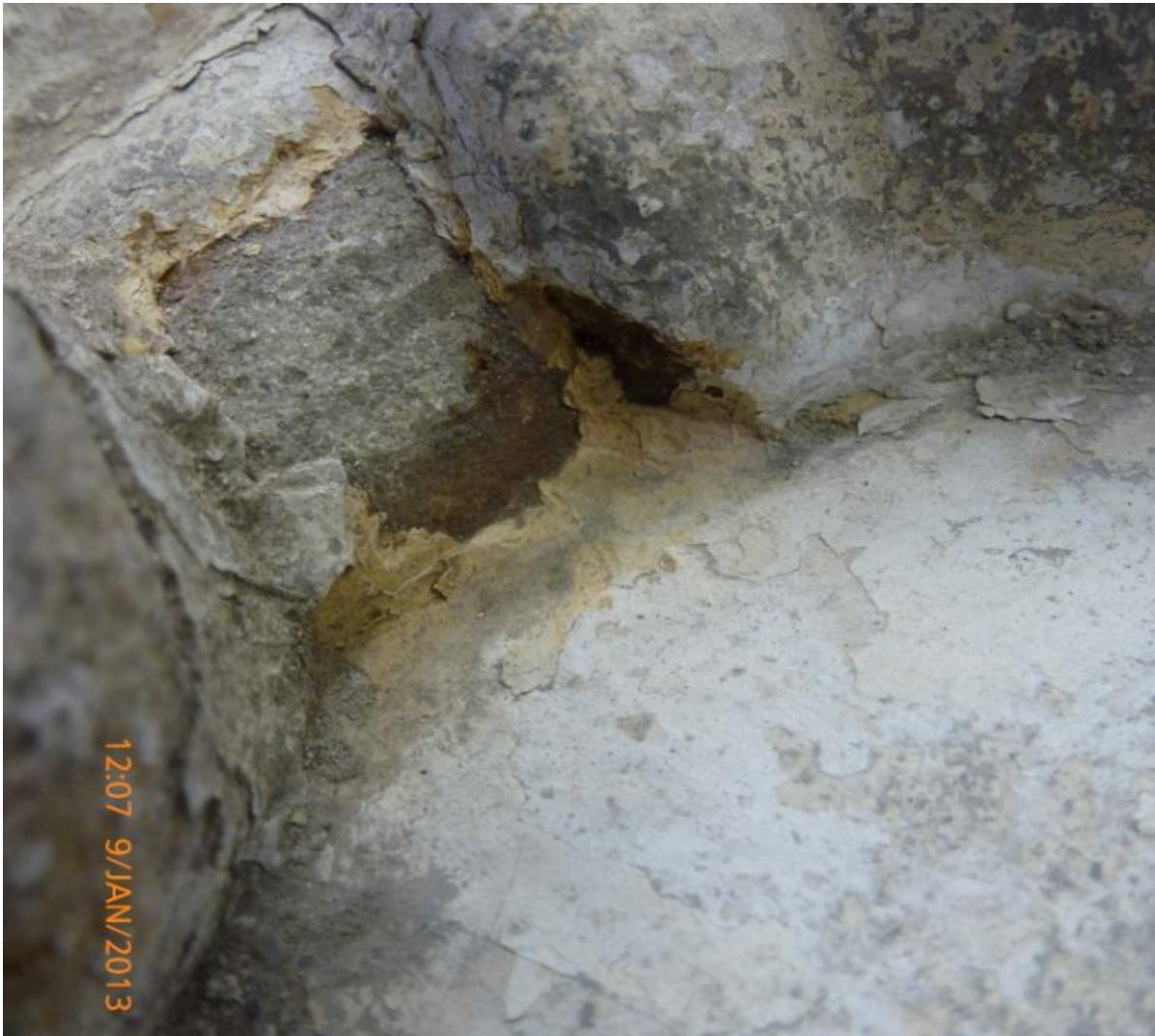
Afb. 28: De witte laag rechts op de steen, waaronder in een hoekje weer okerkleur vandaan komt.

De witte kleur die nu op de achtergrond / ovaal zit is kalkkleurig tot bijna grijswit. Deze laag komt ook op de andere kale delen van de steen terug, maar lijkt niet erg oud te zijn; ze is erg bros en brokkelt snel af. We ontdekken ook in een klein hoekje dat deze lichte kleur boven op de oude okerlagen is gezet. Vermoedelijk is het een kleurbehandeling van de steen die tussendoor is gedaan om het geheel weer egaal van kleur te krijgen (misschien halverwege de 19 e eeuw).