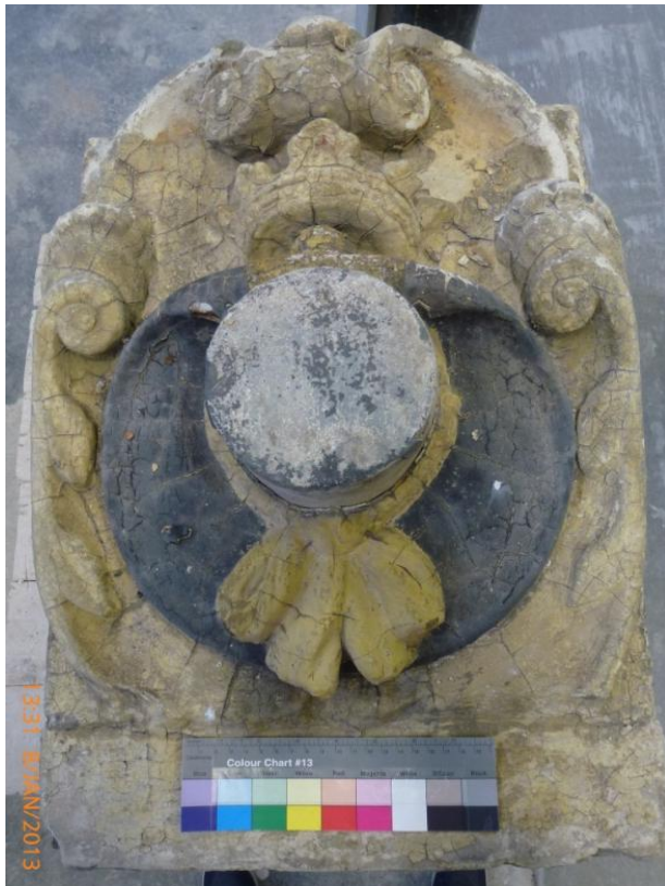
Afb. 1 Gevelsteen De Blauwe Hoed