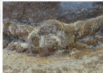
Afb. 19: Detail van een rozetje of knoop aan de zijkant van de bol.