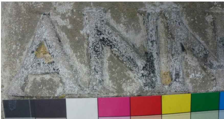
Afb. 25: de letters ANNO zijn vrij kaal en laten enkel zwarte/donkere verflagen zien.

De jaaraanduiding 'ANNO' en '1652' hebben wel verschillende lagen zwart gekend, wat logisch is aangezien de jaaraanduiding het belangrijkste onderdeel van de steen was en daarom ook wel wat accentuering mocht gebruiken. In het kuiltje van de 'A' is weer flink wat oker/bentheimer teruggevonden, maar geen sporen van andere kleuren die zouden zijn gebruikt voor de achtergrond.