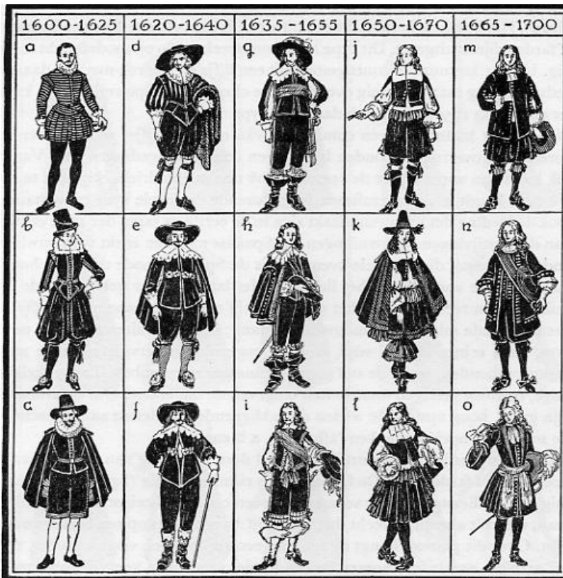
Afb. 14: een overzicht van de veranderende herenmode in de 17 e eeuw. Bij c vertoont de hoed de meeste overeenkomsten met 'De Blauwe Hoed'.