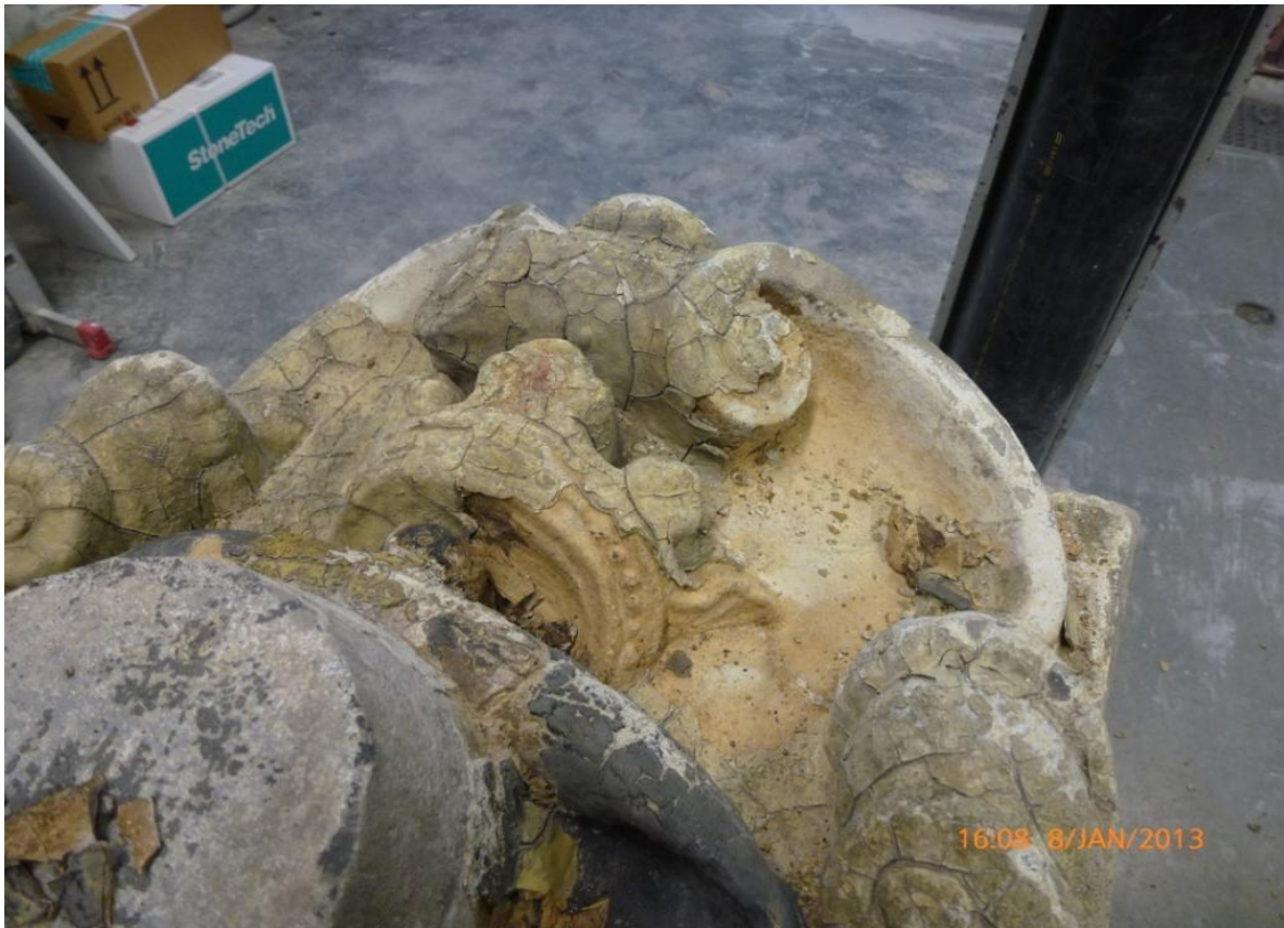
Afb. 32: De kroon tijdens vrijlegging. Heel duidelijk zichtbaar is de vroegste okergele laag.