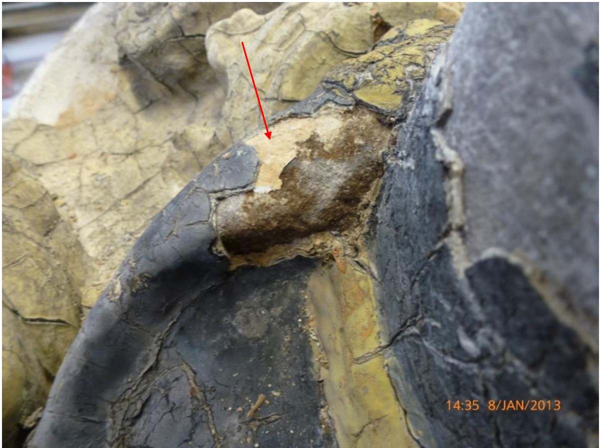
Afb. 29: detail van de vrijlegging van de hoed; zichtbaar is de oudste lichte okerkleur op de rand.