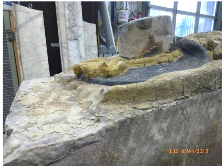
Afb. 9 en 10: De steen van de bovenzijde en een blik vanaf de zijkant waarbij het hoogrelief duidelijk zichtbaar is.

De gevelsteen is bedekt met een dik verfpakket dat flink gecraqueleerd is en hier en daar (vooral aan de bovenzijde en op de bol van de hoed) zelfs hele stukken mist. De hoed is diep donkerblauw tot zwart gekleurd en de strik heeft als laatste een contrasterende kleur geel gekregen. De cartouche en het kroontje zijn zandsteenbeige geschilderd en vormen zo een neutrale achtergrond.