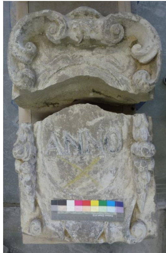
Afb. 2: Gedenksteen met het woord 'ANNO'