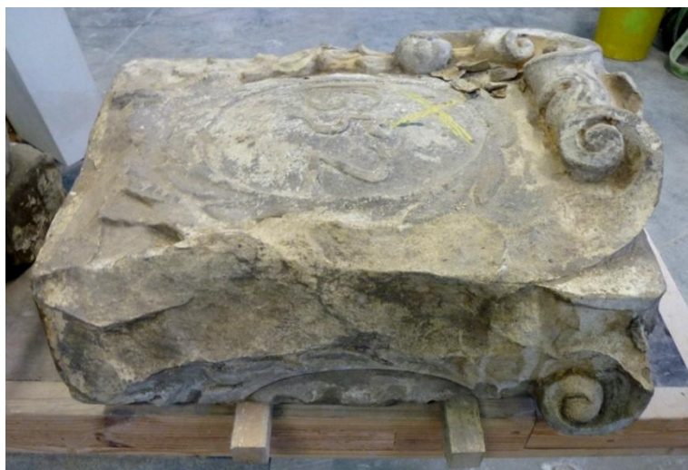
Afb. 12: Steen '1652' vóór restauratie.