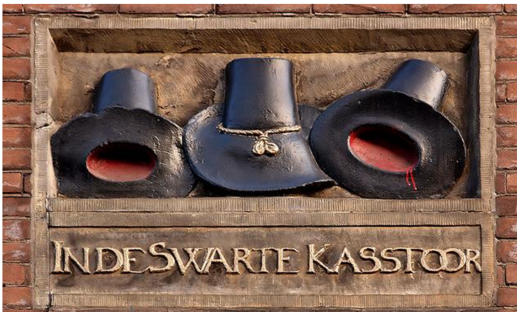
Afb. 23: Gevelsteen 'In de Swarte Kasstoor', aan Rozengracht 204 te Amsterdam