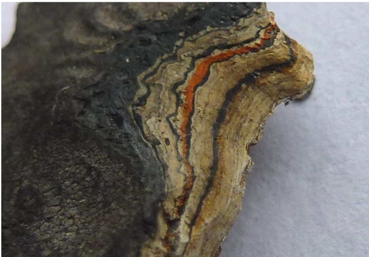
Afb. 30: een doorsnede van een verfmonster van de hoedrand. Duidelijk zichtbaar is de oranje kleur.