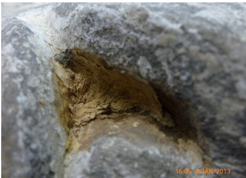
Afb. 27: Detail van de verfresten, diep weg in een hoek van de cartouche.