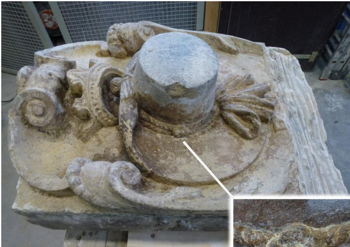
Afb. 18: 'De Blauwe Hoed' na gehele vrijlegging van de steen.

Afb. 21, 22 en 23 komen het meest overeen, waarbij de gouden kleur van de eerste behoorlijk in het oog springt. Het is niet bekend of deze kleur volgens kleurhistorisch onderzoek en na raadpleging van bronnen is aangebracht. De zwarte kleur van afb. 22 en 23 komt overeen met de historische klederdracht zoals eerder in dit hoofdstuk is besproken.