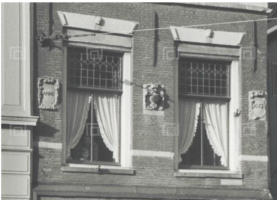
Afb. 8: Historische gevel Breestraat 79, detail uit foto door Herman Kleibrink in 1956 (Bron: Beeldbank RAL, signatuur PV104363)