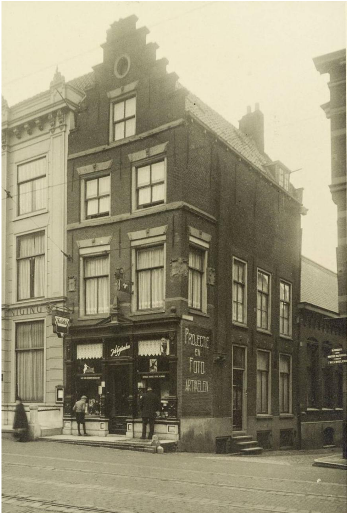
Afb. 6: Hoekgevel Breesstraat 79, foto van situatie begin 20 e eeuw.