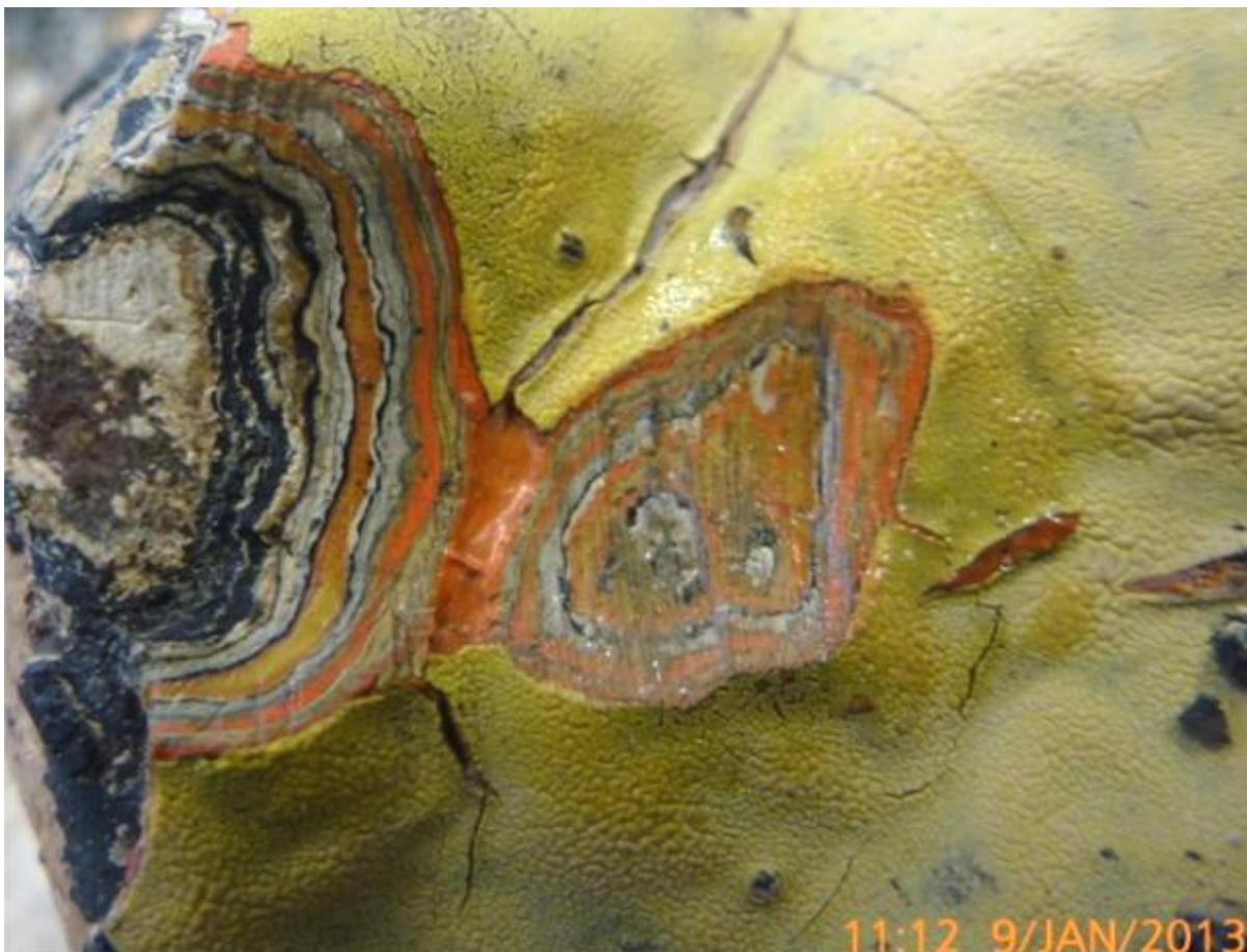
Afb. 31: doorsnede aan de punt van de strik. Veel oranje en geel in de laatste twee eeuwen.