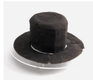
Afb. 13: begin 17 e eeuwse vilten hoed, afkomstig uit een koopvaardijship.

Historisch gezien is de hoed in vorm vergelijkbaar met een staalmeestershoed, of zogenaamde vilten castoor ('castoor' is Oud-Nederlands voor vervilt beverhaar). Deze hoeden waren tussen 1600 en 1700 populair onder de rijke burgerij en rijke middenklasse. De heren kleedden zich voornamelijk in donkere kleding (blauw tot zwart) om hun rijkdom te laten zien; pure donkere kleuren waren duurder omdat de kledingstukken met deze kostbare pigmenten moesten worden gekleurd.