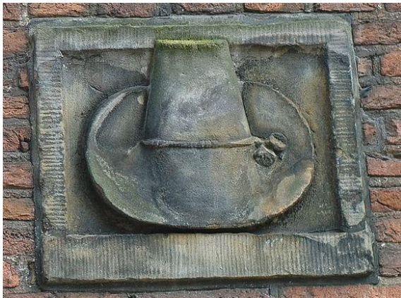
Afb. 22: Gevelsteen Hoed aan de St. Luciënssteeg te Amsterdam, vóór en na restauratie