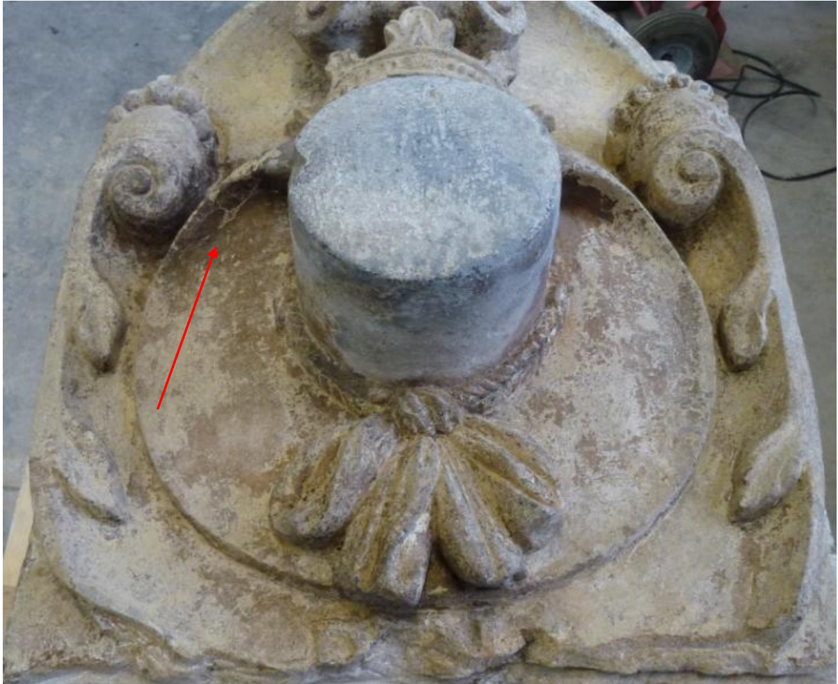
Afb. 40: de hoed met de reparatie links.