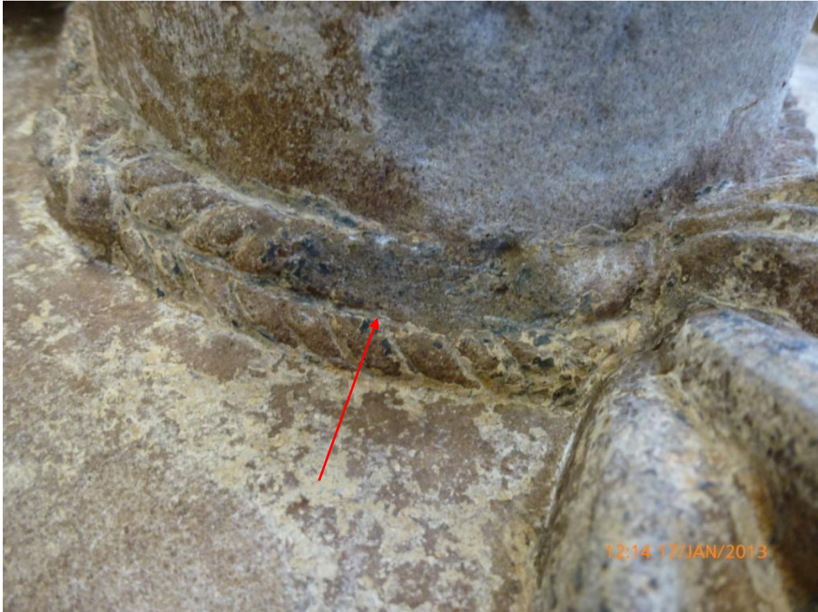
Afb. 42: de beschadiging in het koord, niet gerepareerd maar wel overheen geveerd.