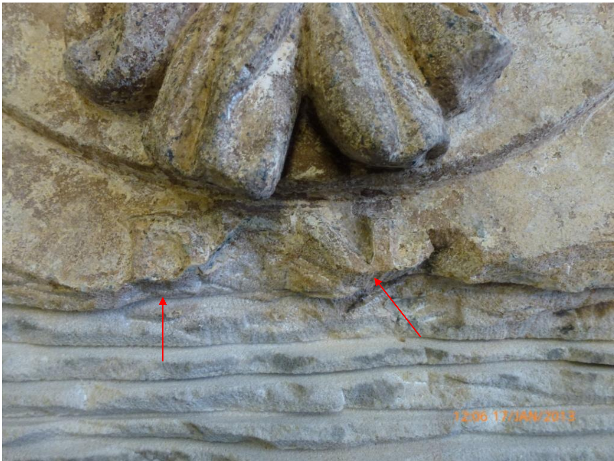
Afb. 39: letters (of resten van Romeinse cijfers?) direct onder de hoed, links een 'D', rechts resten die lijken op een 'N'.

Er zijn direct ónder de hoed resten van de letters 'D' en 'N' (een eerste vermoeden?) onder alle lagen verf tevoorschijn gekomen. Er zijn hier duidelijke beitelsporen te zien; een steenhouwer heeft in het verleden vermoedelijk door een bewoner/eigenaar van het pand de opdracht gekregen om deze letters (of was het misschien een jaartal?) te verwijderen, waarschijnlijk omdat ze niet naar hem verwezen. Dit zou een leuke casus kunnen zijn voor een vervolgonderzoek en het zorgt misschien voor nét dat extra beetje informatie waardoor de herkomst en de opdrachtgever van de steen kunnen worden achterhaald.