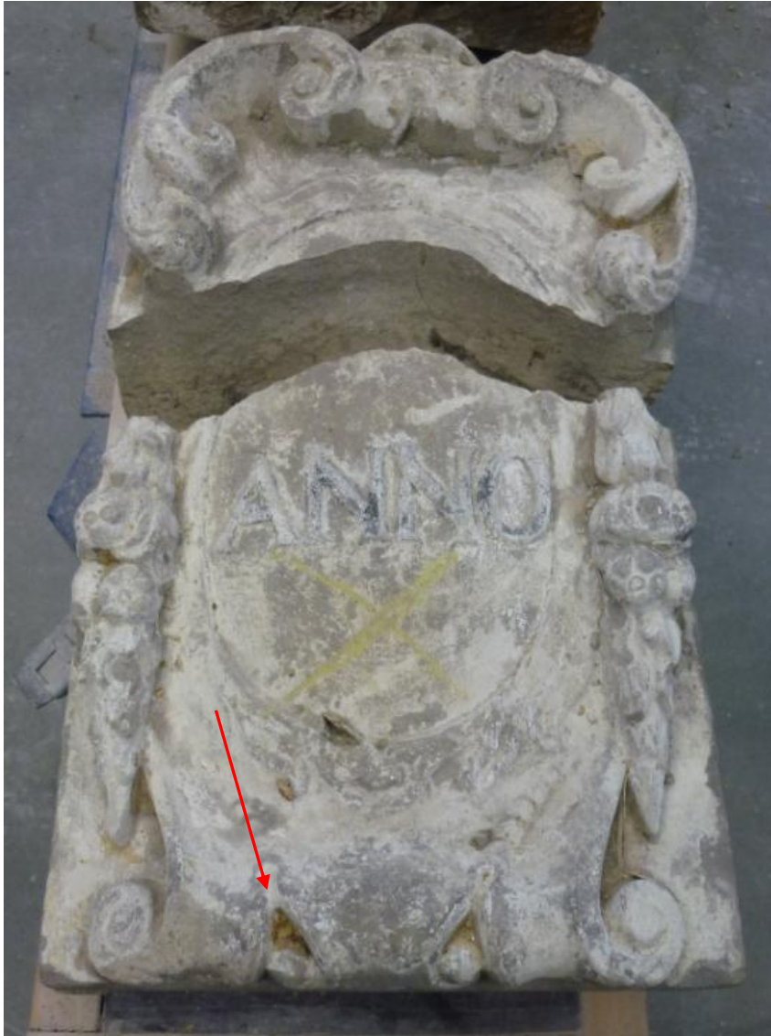
Afb. 26: Steen ANNO, onderaan links is de verfrest te zien.