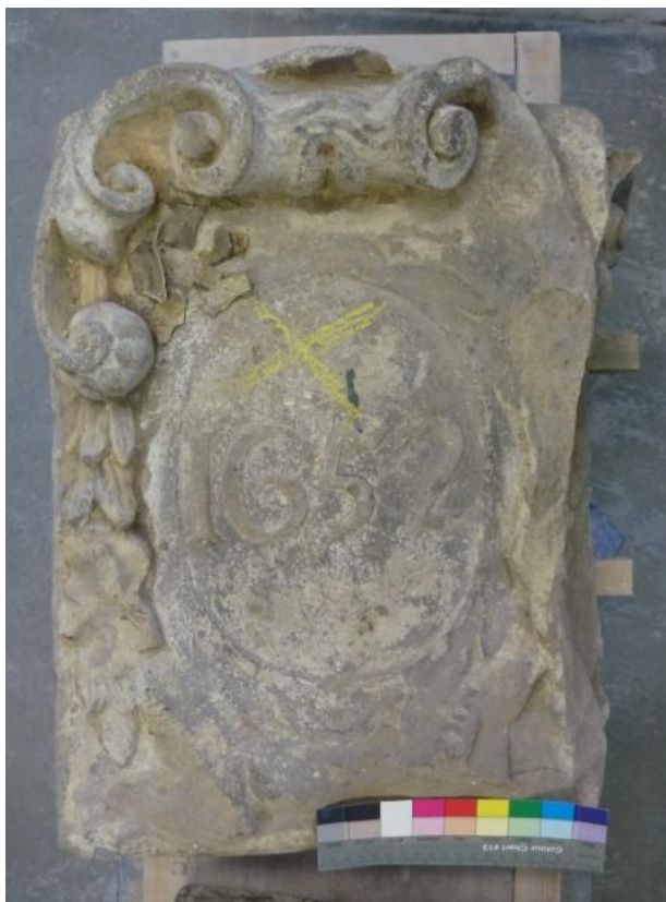
Afb. 3: Gedenksteen met het jaartal '1652'.