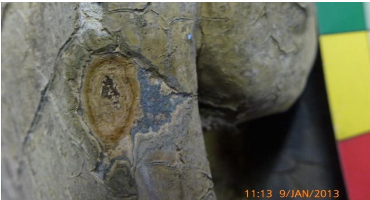
Afb. 34: de verschillende kleurlagen op een rollaag van de cartouche.