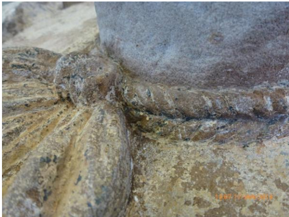
Afb. 35: detail strik met koord

De detaillering van de gevelsteen bleek na vrijlegging erg mooi te zijn en het steen- of beeldhouwwerk van hoge kwaliteit. De strik bleek een dubbel koord, met zelfs wat kleine rozetjes aan de zijkant van de bol. Op de bovenrand van de hoed werd ook een strik zichtbaar en de knobbel kreeg duidelijker vorm. Ook het koord en de strik bovenaan de hoed bleken als eerste van een dikke okerlaag te zijn voorzien, met daarop een zwarte verflaag.