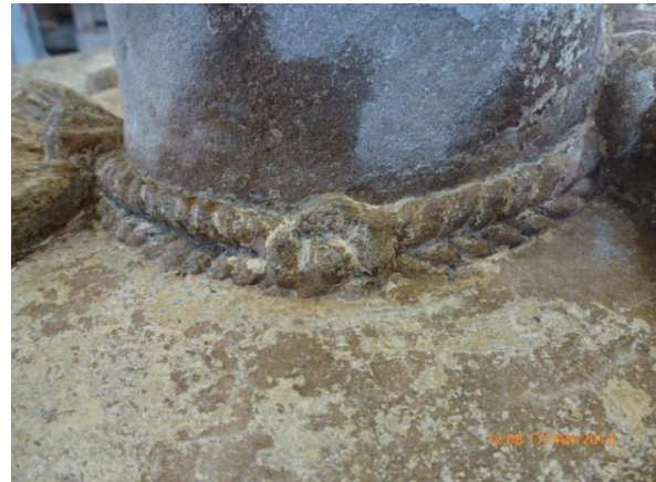
Afb. 36: rozet aan de zijkant van de bol