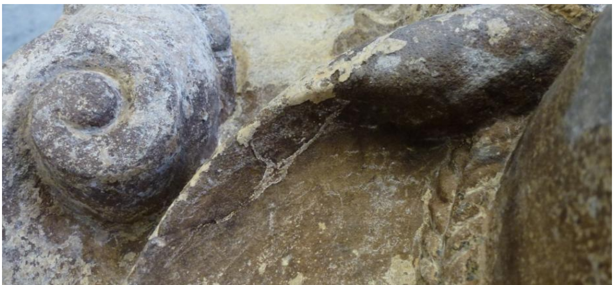
Afb. 41: detail met de reparatie