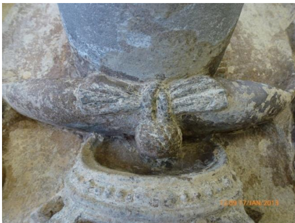
Afb. 37: de strik bovenaan de hoed, met knobbel