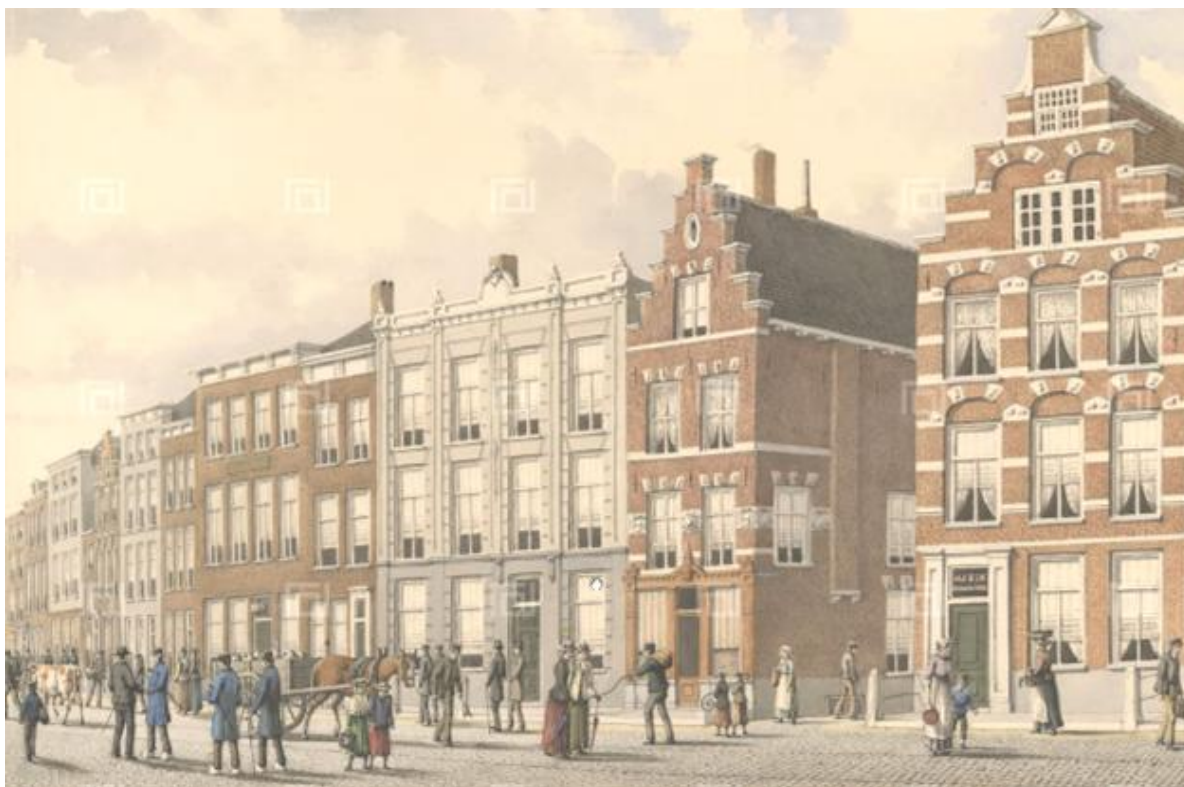
Afb. 7: Geschilderd stadsgezicht met Breestraat nrs 79 tot 97, gouache door J.M.A. Rieke in 1896.