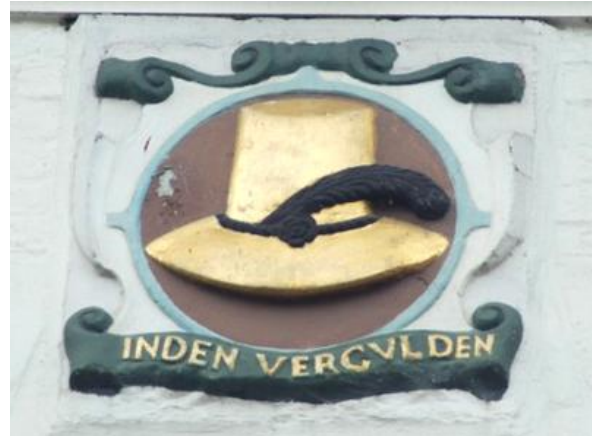
Afb. 21: Gevelsteen 'In den vergulden hoed' aan Markt 34-36 te Den Bosch