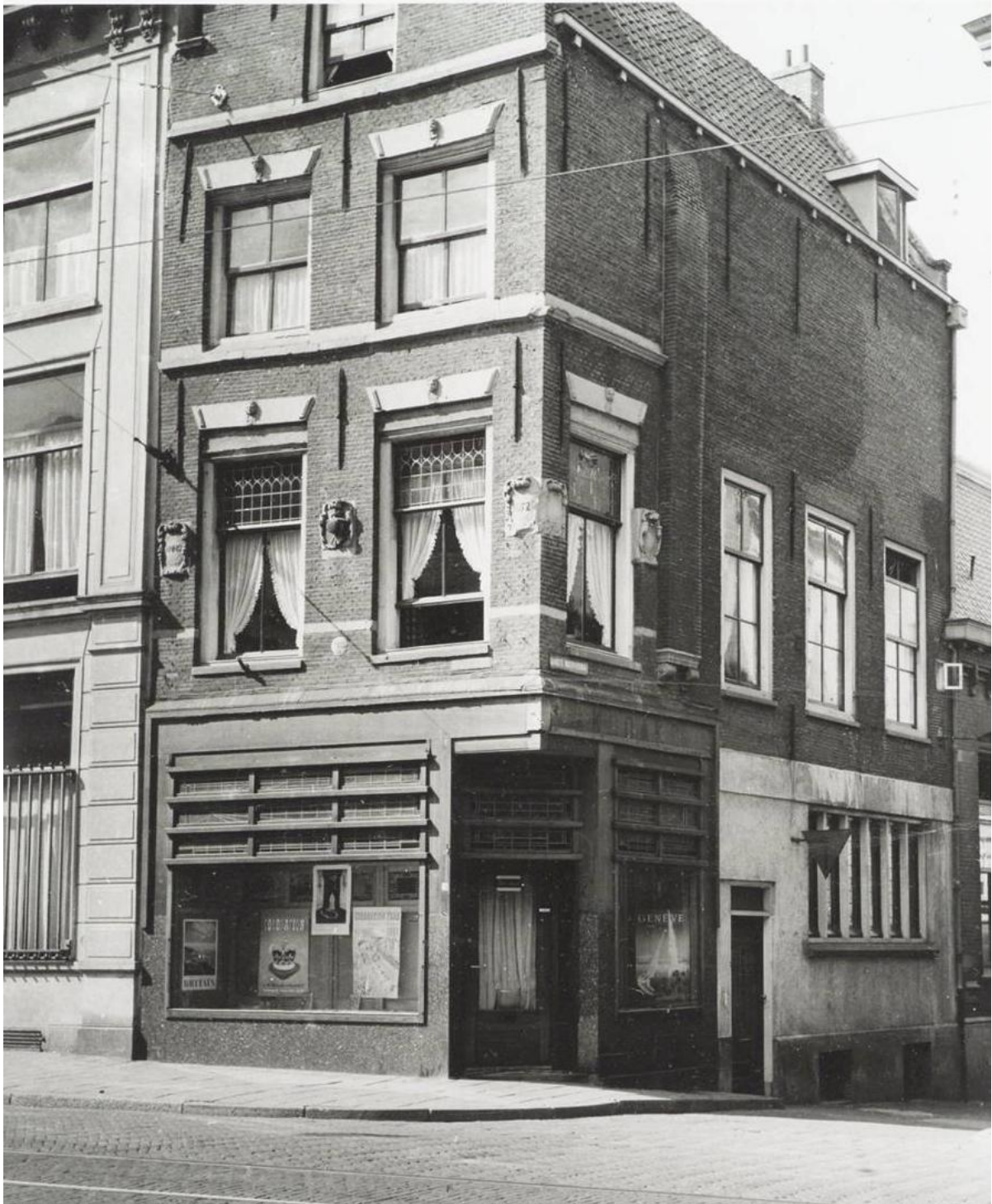
Afb. 5: Hoekgevel Breesstraat 79, foto in elk geval van na 1950. Maker N. vd Horst. (Bron: RCE, OF05352).

foto's waarop de steen duidelijk dienst doet als hoeksteen. Helaas is het rechter hoekgedeelte (nog) niet teruggevonden, en ook is het nu de vraag waar de vierde steen is gebleven die aan de zijkant van het huis in de gevel prijkte.