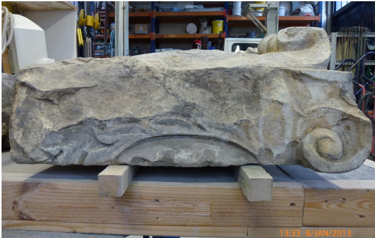
Afb. 4: De rechterzijde van gedenksteen '1652', met duidelijke sporen van aangebracht rolwerk en gebladerte.

Op afbeelding 1, 2, 3 en 4 zien we de uitgehaalde gevelstenen ter behandeling in het atelier van BamBam Steenhouwers. Afbeelding 5 t/m 8 zijn archiefbeelden uit het RAL en het archief van de RCE, waarop de locatie van de stenen in de originele gevel te zien is. Bijzonder is het geschilderde stadsgezicht van Johannes Rieke (afb. 7), een Amsterdamse tekenaar met een voorliefde voor het in kleur vastleggen van stadsgezichten ii . De foto van rond 1900 van het RCE (afb. 6) en de tekening door Rieke laten ons het vroegste beeldmateriaal van de gevel zien. Door de foto's wordt het ons duidelijk dat het gevelsteenensemble uit méér stenen bestond dan ons nu bekend zijn: in de voorgevel links te beginnen met steen 'ANNO', in het midden gevelsteen 'De Blauwe Hoed' en aan de rechterzijde gedenksteen '1652', die een hoeksteen blijkt te zijn waarvan de rechterzijde zich in de zijgevel van het pand bevond. Aan de andere zijde van het venster in de rechterzijgevel prijkte nog een vierde gevelsteen. Alle stenen waren mooi op de eerste verdieping op dezelfde hoogte tussen de vensters in de bakstenen gevel geplaatst.