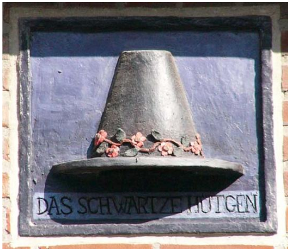
Afb. 24: Gevelsteen 'Het Zwarte Hoedje' aan Limbrichterstraat 29 in Maastricht