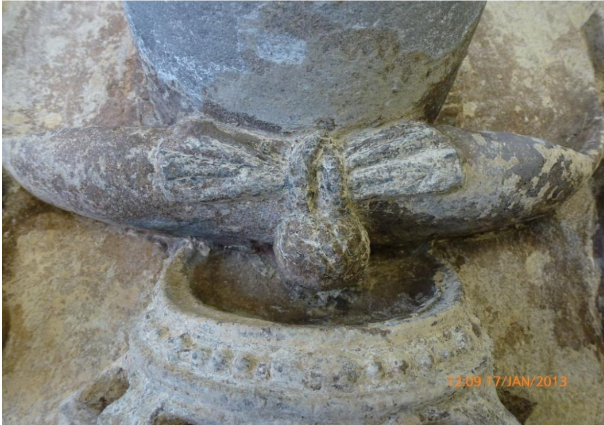
Afb. 17: de knop met strik aan de bovenzijde van de hoed, die onder de vele verlagen vandaan kwam.