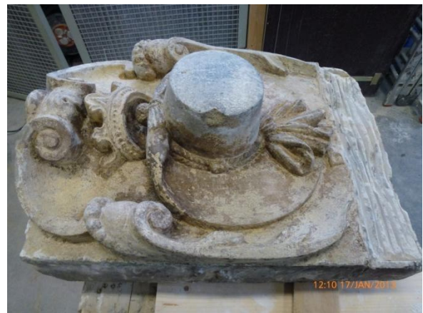
Afb. 38: De hoed, vrijgelegd.