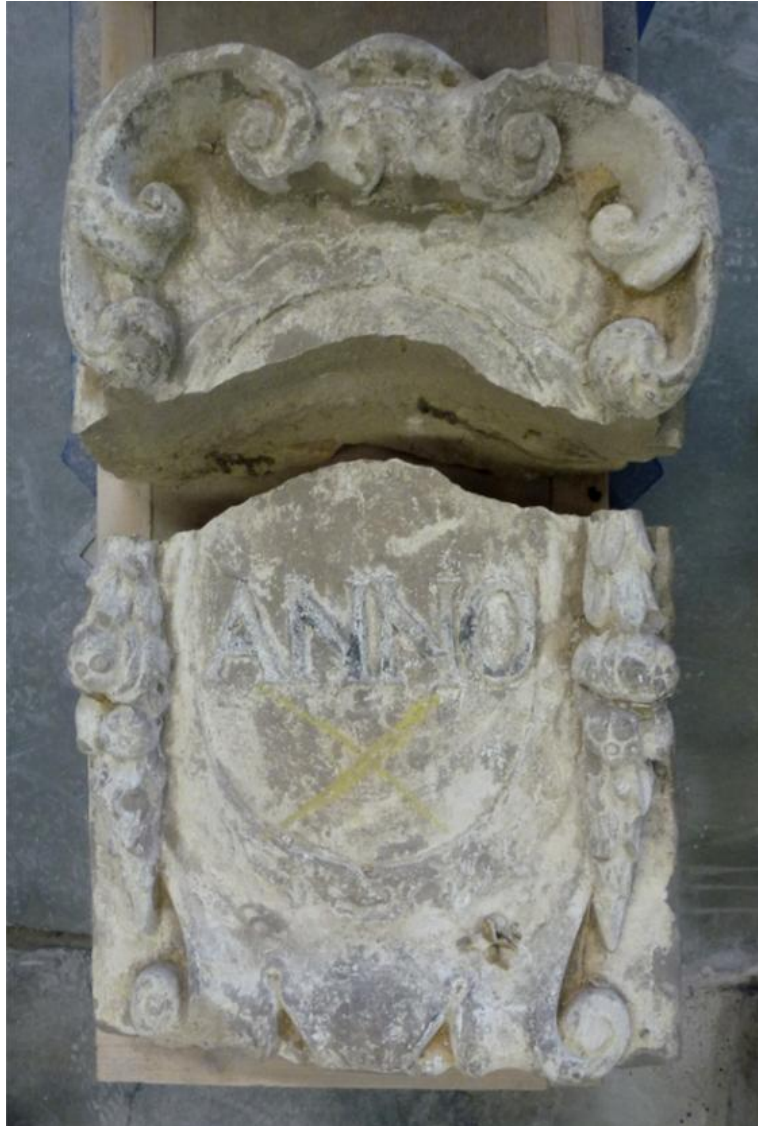
Afb. 11: Steen 'ANNO' in twee stukken.