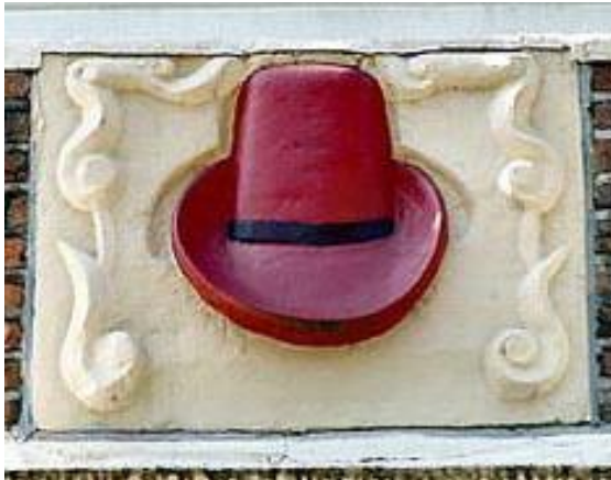
Afb. 20: Rode hoed aan Keizersgracht 104 te Amsterdam